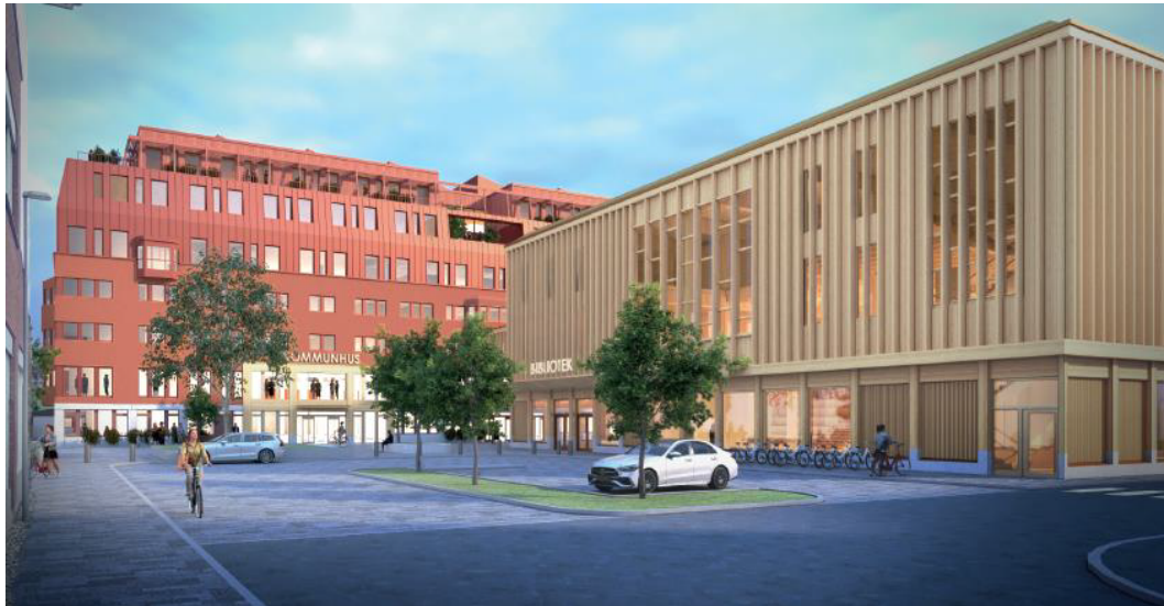
Vy från Paradistorget över biblioteket (till höger i bild) och kommunhuset. Bild: White arkitekter AB

Biblioteksbyggnaden föreslås att uppföras med ett ribbverk av trä och glas som löper runt hela byggnaden. Det skapar en öppen fasad samtidigt som byggnaden riktar sig utåt och slutna fasader och baksidor kan undvikas. Byggnaden kan förses med ett biotoptak, som både hanterar dagvatten och bidrar till biologisk mångfald, och lanterniner som släpper in ljus ovanifrån.