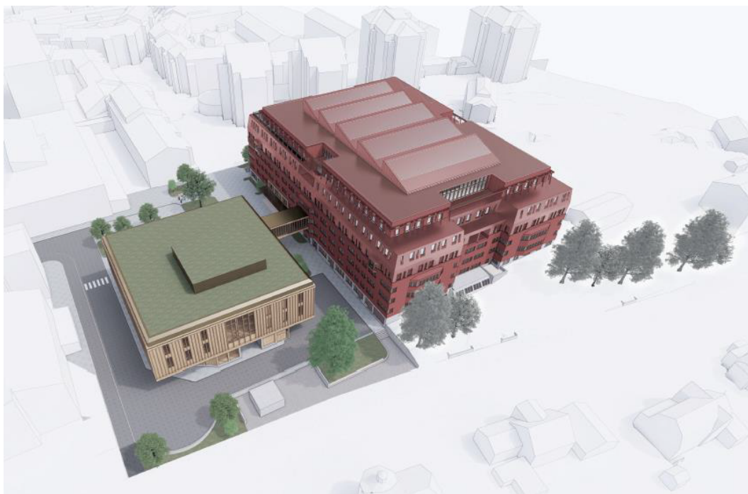
Flygvy från söder. Bild: White arkitekter AB

På kvartersmarken planeras för en torgyta i anslutning till kommunhusets och bibliotekets entréer. Platsen syftar till att binda samman ytan framför den nya bebyggelsen och samtidigt förstärka den visuella och fysiska kopplingen mot Sjödalstorget.